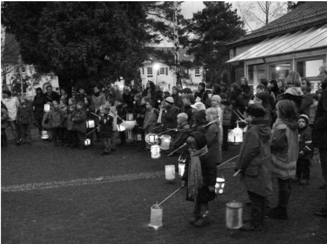
Auch dieses Jahr kamen wieder zahlreiche Kinder und Familien zum Martinsumzug in Kleinmachnow